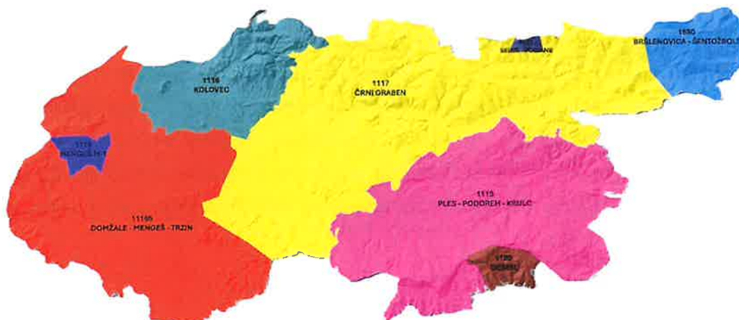
Slika 1: Vodovodni sistemi v upravljanju Javnega komunalnega podjetja Prodnik

Za morebitna dodatna vprašanja glede izvajanja oskrbe s pitno vodo ter na podlagi utemeljene zahteve imajo uporabniki možnost dostopa do podatkov za posamezne vrednosti parametrov preko elektronske pošte na elektronski naslov info@jkg-prodnik.si ali po telefonu na 01 72 95 430 (tudi dežurna številka za javljanje okvar). Uradne ure na sedežu podjetja so ob ponedeljkih od 8. do 10. ure, sredah od 8. do 10. ure in od 14. do 16. ure ter petkih od 8. do 10. ure.